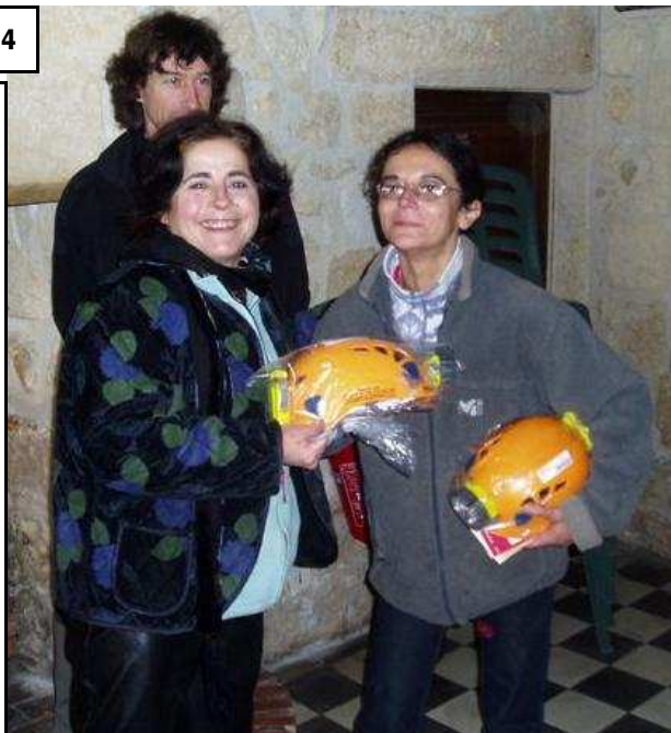
Dans le cadre du Rassemblement Jeunes Aquitain en Dordogne

Assemblée Générale le Samedi 28 Janvier De 14 H 30 à 18 H 30 au Complexe de La République à Pau