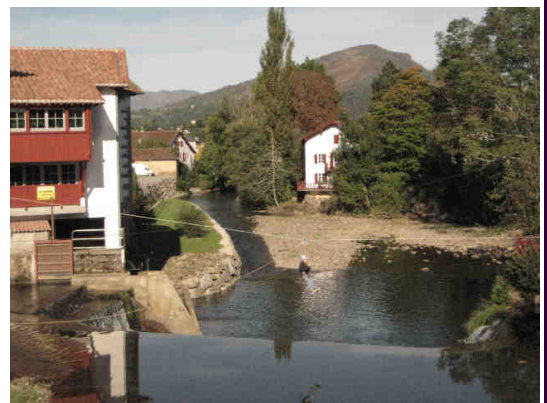
La tyrolienne

pendant le weekend, la météo, et le sourire des gens à la sortie des grottes, on peut aisément qualifier ces JNSC 2008 de Triomphe !