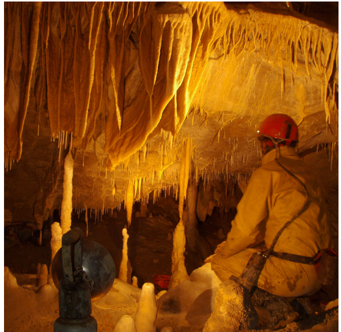
Grotte Maddalen - Camou-Cihigue

Celui-ci sera, j'en suis persuadé, très structurant pour nous. Le risque concomitant est que le CDS se trouve accaparé en totalité par cette action. Mon objectif est donc de garantir et développer la place et le rôle de nos commissions, en laissant à ceux qui souhaitent s'y investir autonomie et responsabilité, dans le respect des activités des clubs.