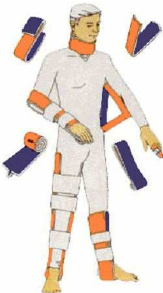
Exemples d'utilisation des attelles Sam Splint™

Si vous désirez en acquérir une (ou plusieurs), envoyez un chèque à l'ordre du CDS 64.